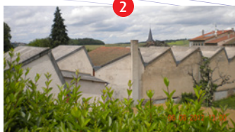
Ancienne usine Romagny