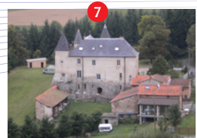
Château de Ste Colombe