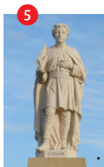
Statue de St Julien