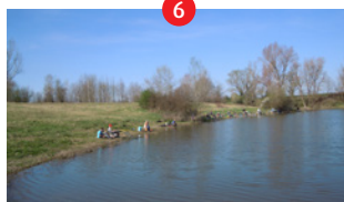
Bords de Loire, sentier de la gravière