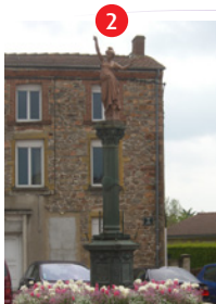
Statue de la République