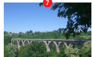
Viaduc de Chessieux