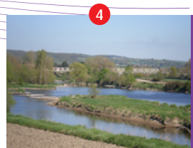
Pont de la Loire